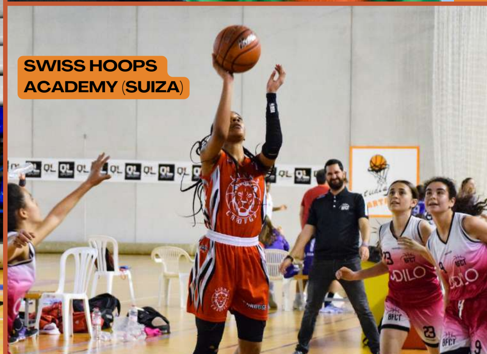
SWISS HOOPS ACADEMY (SUIZA)