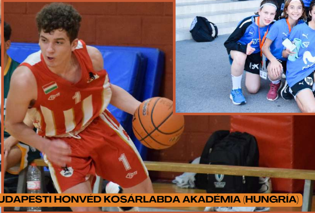
BUDAPESTI HONVÉD KOSÁRLABDA AKADÉMIA (HUNGRÍA)