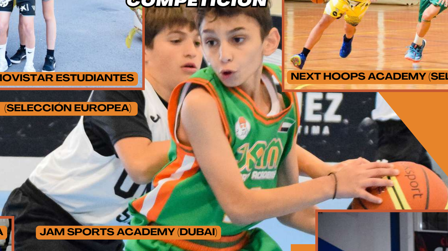
JAM SPORTS ACADEMY (DUBAI)