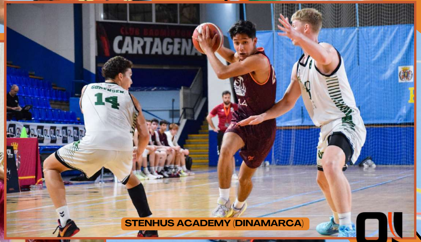
STENHUS ACADEMY (DINAMARCA)